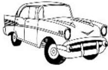
. يـارة .