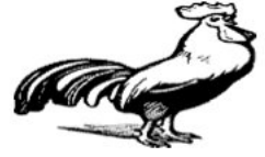
. يك .