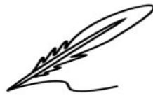
. يشة .